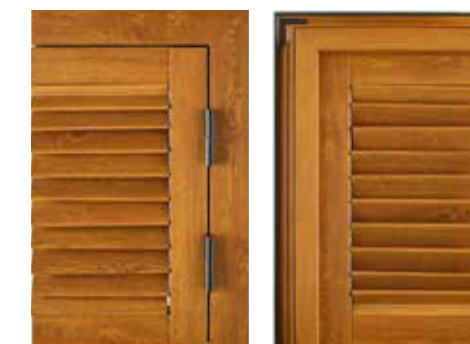
VISTA ESTERNA EXTERNAL VIEW

THE SHUTTER WHICH RESONATES WITH THE OUTSIDE WORLD Creates suffused lighting in rooms. Enable excellent ventilation.