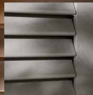
Diomedea lamelle fisse fixed strips

The beauty of fixed, adjustable strips and slats: a timeless design which unites beauty and practicality.