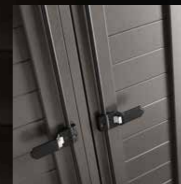
Diomedea doghe orizzontali horizontal slats