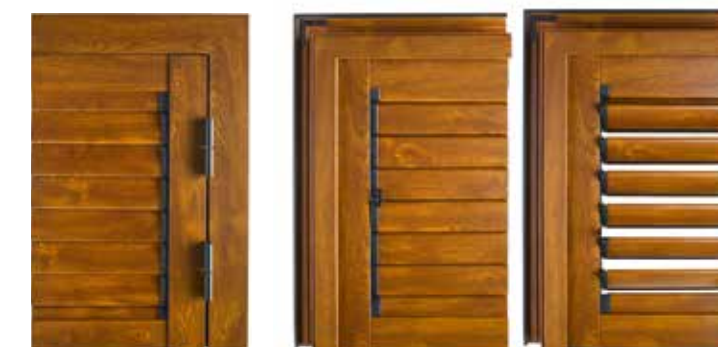
VISTA ESTERNA EXTERNAL VIEW

AN ELEGANT, DYNAMIC STRUCTURE Bestows light and ventilation Offers protection from prying eyes.