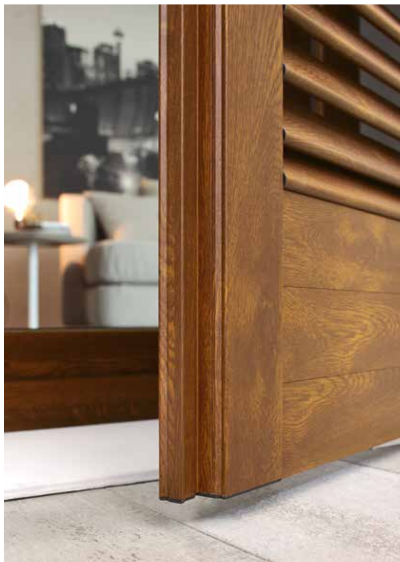
Persiana 2 ante a lamelle fisse in finitura Renolit chiaro con apertura battente.

The beauty of finishes the strength of the structure