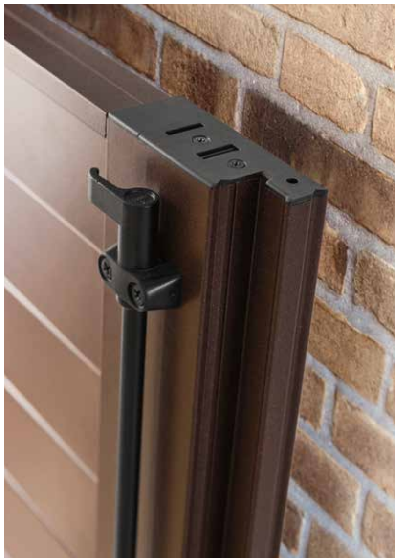
Persiane 2 ante a doghe orizzontali in finitura Marrone Marmo con apertura battente.

The charm of colour, the harmony of the slats