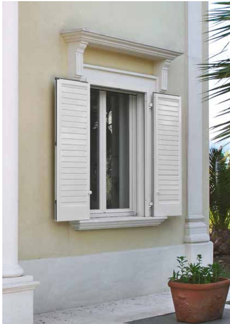
Persiana 2 ante a lamelle orientabili in finitura Bianco Ral 9010 con apertura battente.

2-leaf shutter with adjustable strips in White Ral 9010 finish with side hinged opening.