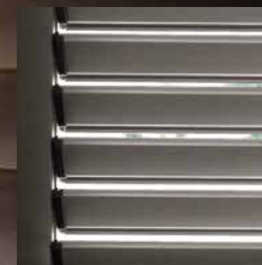
Diomedea lamelle orientabili a goccia Drop-shaped adjustable strips