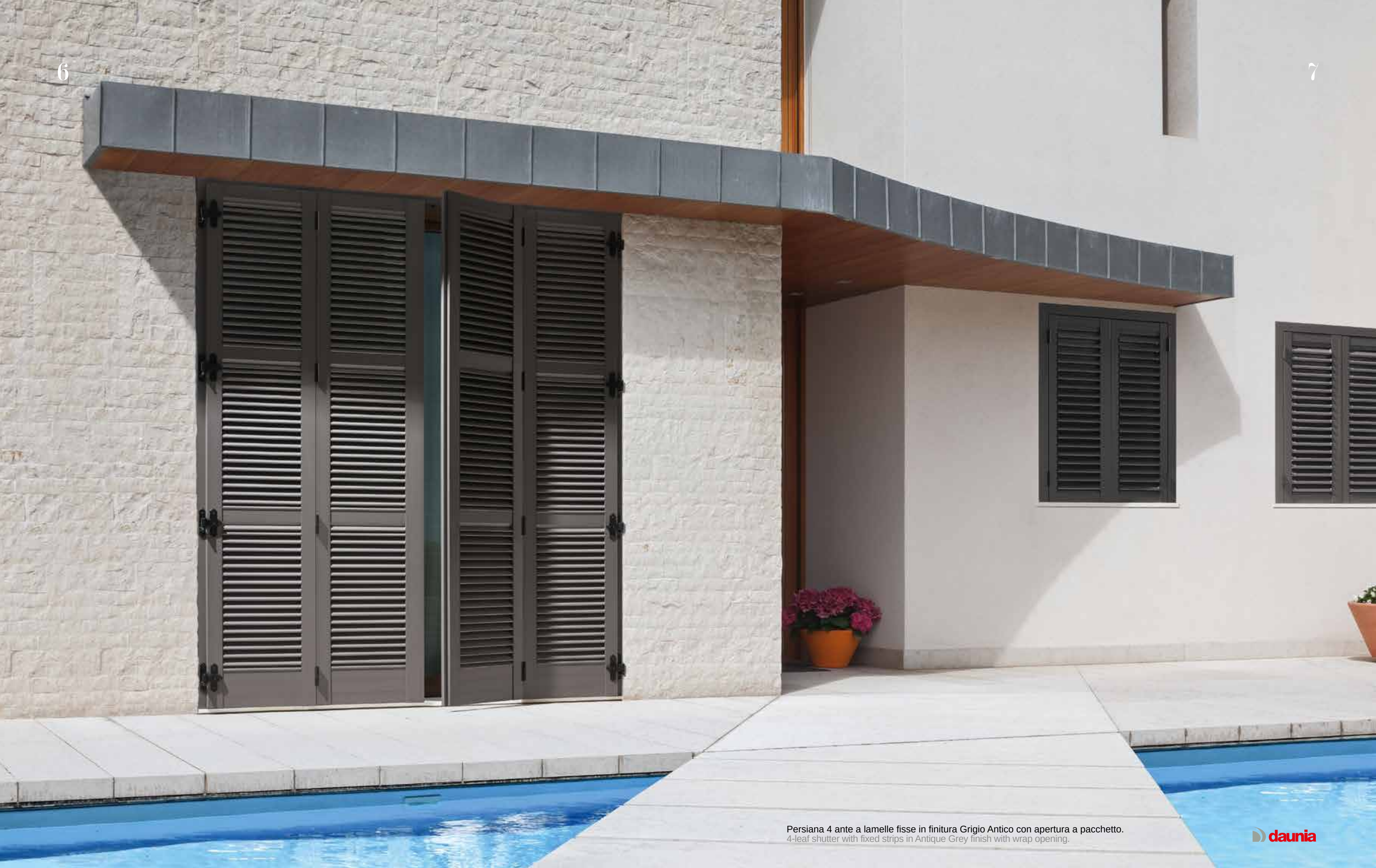
Persiana 4 ante a lamelle fisse in finitura Grigio Antico con apertura a pacchetto. 4-leaf shutter with fixed strips in Antique Grey finish with wrap opening.