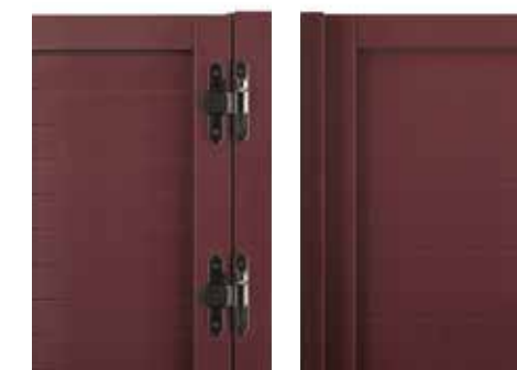
VISTA ESTERNA EXTERNAL VIEW

THE DECORATIVE CADENCE OF TRADITION Guarantees a traditional and elegant style within rooms. Bestows great decorative value.